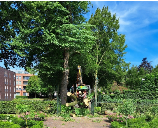
de linde wordt weggehaald

Tijdens de zomerstorm van 5 juli is een van de twee lindes bij de entree omgewaaid. De boom was eigendom van de gemeente en wordt vervangen. Helaas is de symmetrie bij de entree dan niet meer.