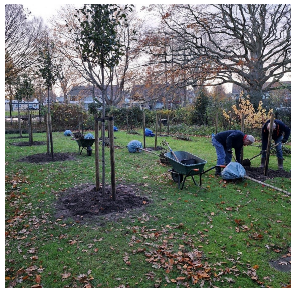
bomen deels geplant

De bomen zijn in eigen beheer geplant. Behalve de aanschaf van de bomen is er ook grondverbetering toegepast en zijn er boompalen aangeschaft.